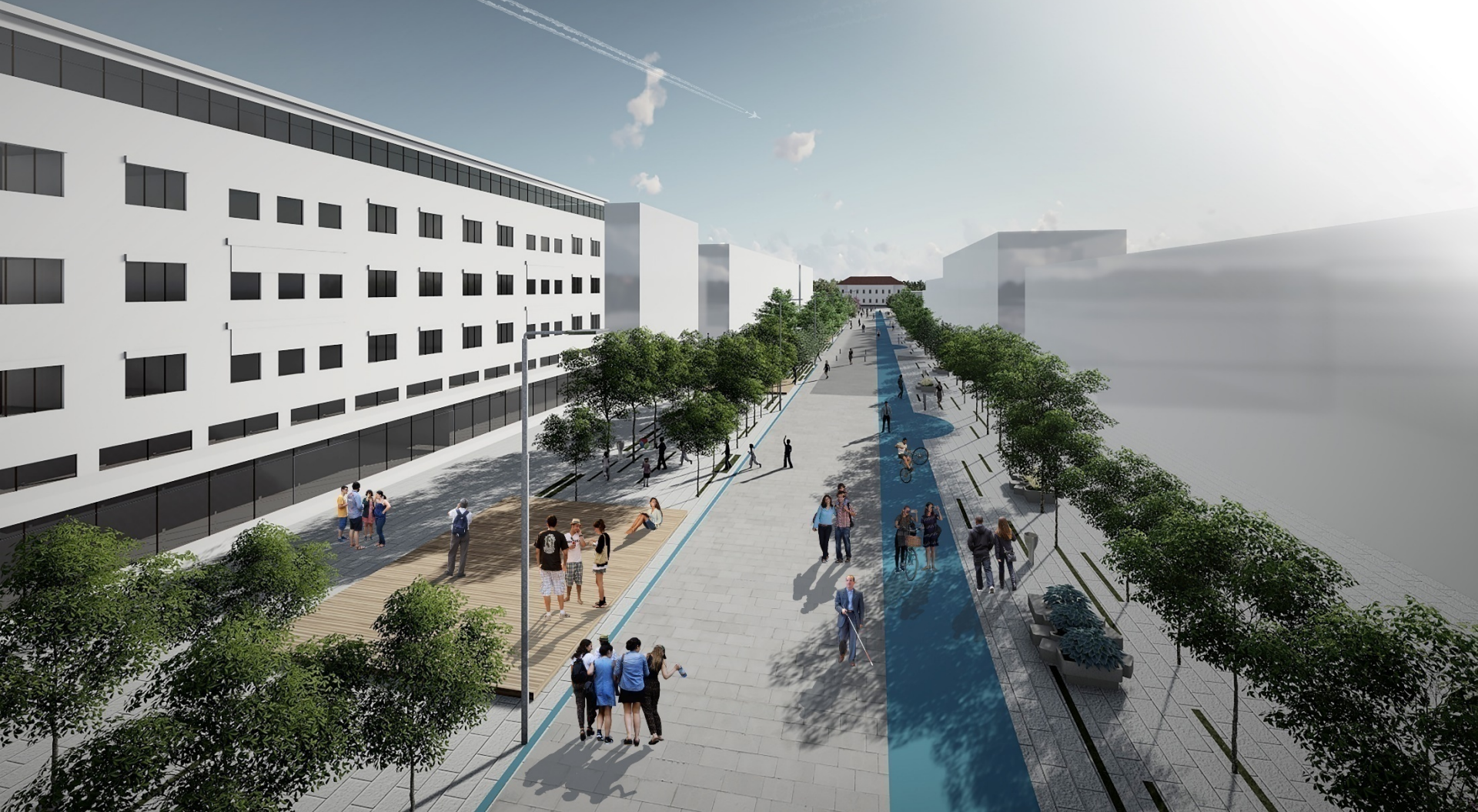
Темерин 2020: Партерно уређење дела центра насеља Темерин др Дубравка Ђукановић д.и.а, КЦОТ, 2017. Илустрација: Микроамбијент улице Петефи Шандора